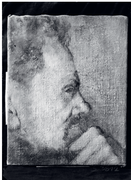
Ota Janeček, Podobizna Josefa Sudka, 1943 olej na plátně