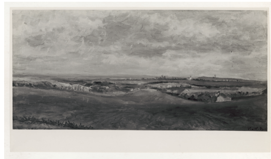
Vlastimil Rada, Krajina foto Josef Sudek, bromostříbrná fotografie