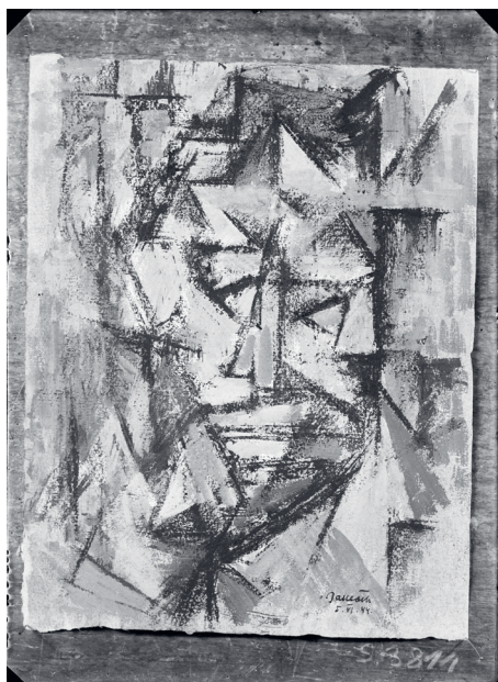
Ota Janeček, Podobizna Josefa Sudka, 1944