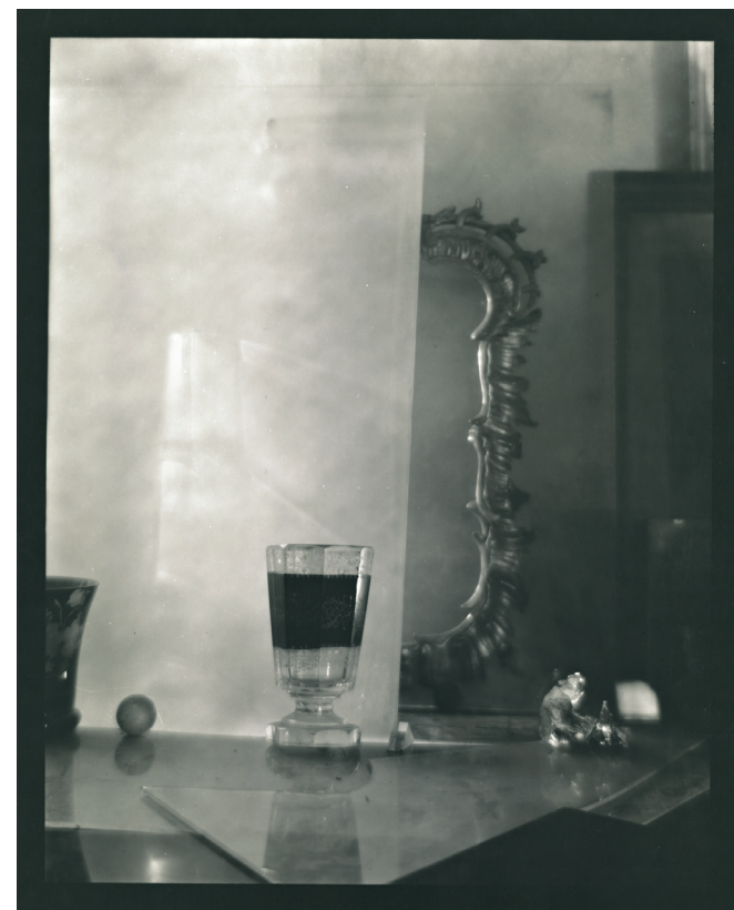
Skleněný labyrint II, 1968–72 bromostříbrná fotografie