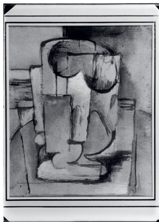
Ota Janeček, Sklenice, 1943 kvaš na plátně foto Josef Sudek, digitálně upravený negativ